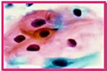
เซลล์มะเร็งปากมดลูก

♀ โดยธรรมชาติการเกิดมะเร็งปากมดลูกจะใช้เวลานานเกือบ 10 ปีนับจากที่เริ่มมีเซลล์เปลี่ยนแปลงไปจนถึงเป็นมะเร็ง